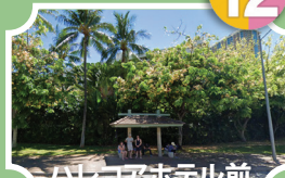
ハレコアホテル前