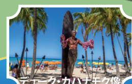
デューク・カハナモク像