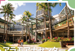
アラモアナセンター